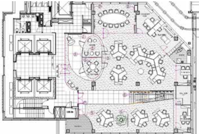
30 th floor